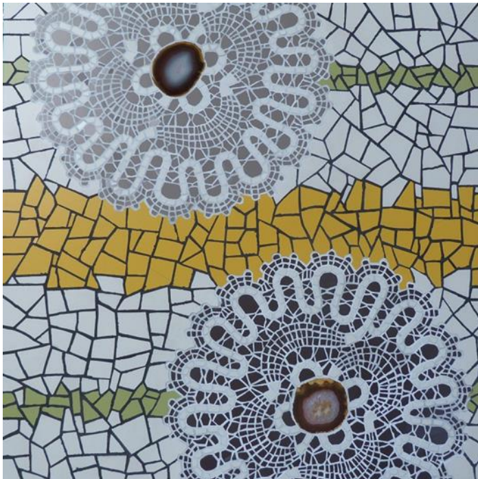
Mozaik 60 x 60 » NASPROTI«